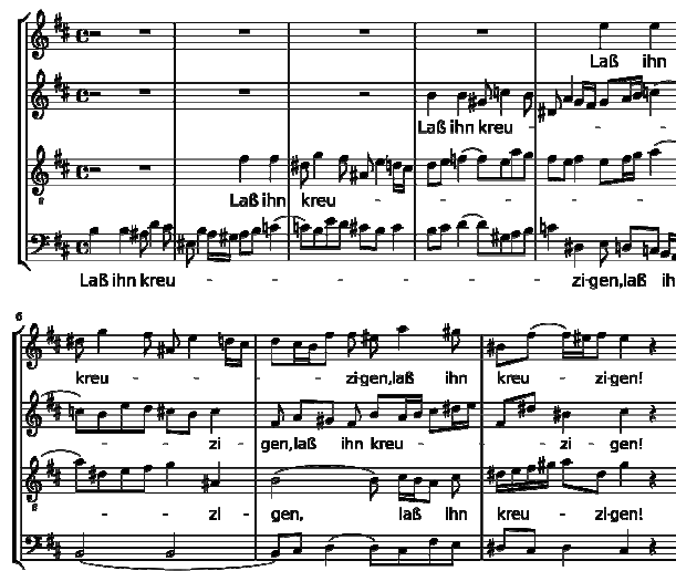
Matthäuspassion: Der Turba-Chor mit den Worten „Laß ihn kreuzigen!“ baut sich von unten nach oben auf.

Für Bach ist der Stoff der Passionsgeschichte ein großes Drama der Welt- und Menschengeschichte – und er inszeniert es musikalisch großartig.